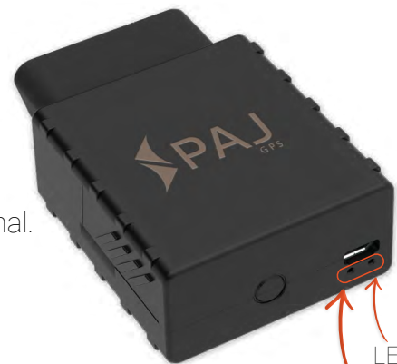
LED- État du FINDER LED- État du signal